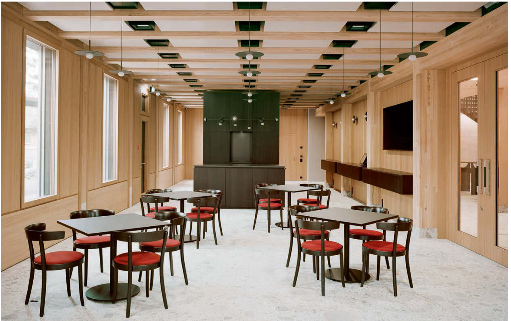
Giswiler Flusskies, Eschen- und Fichtenholz - mit ihrer Materialwahl äußern Seiler Linhart einen Kommentar zum Ort. • With their choice of materials, Seiler Linhart make a comment on the location.