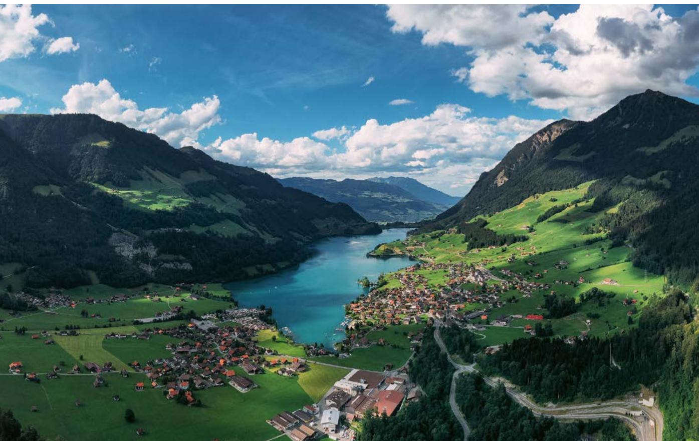
Vista dal Passo del Brünig attraverso Lungern verso Kaiserstuhl

contact@topakustik.ch www.topakustik.ch T +41 41 679 73 73